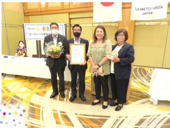
かがわ骨髄バンクを応援する会「感謝状」